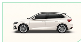
Candy White - 200 €