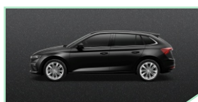
Magic Black - 400 €