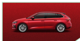
Velvet Red - 500 €