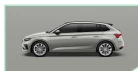
Steel Grey - 400 €