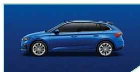
Race Blue - 400 €