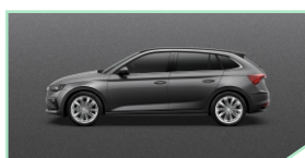
Graphite Grey - 400 €