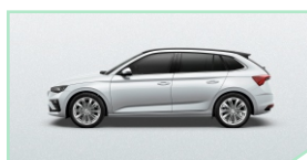
Moon White - 400 €