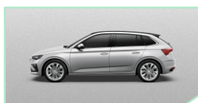
Brilliant Silver - 400 €