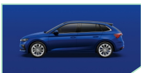
Energy Blue - 0 €